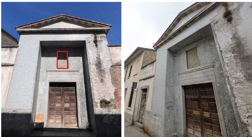
Foto a disposizione come spunto per il ritratto (in allegato a risoluzione maggiore)