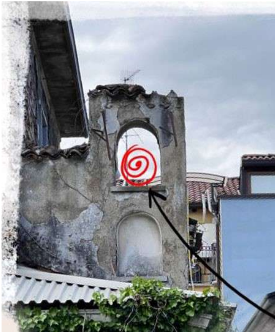
Foto collocazione opera nel riquadro rettangolare della facciata della ex-Cappella.

Le misure indicative dello spazio sono: base 50 cm, altezza (punto più alto) 73 cm.